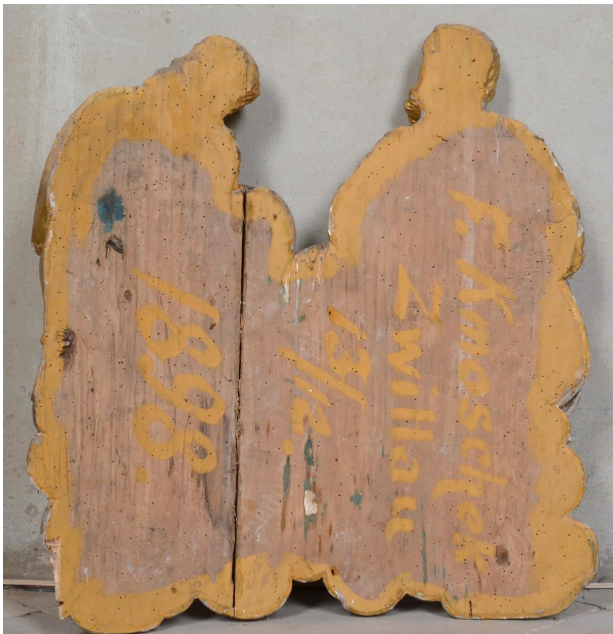
Evangelisté sv. Matouš a sv. Marek