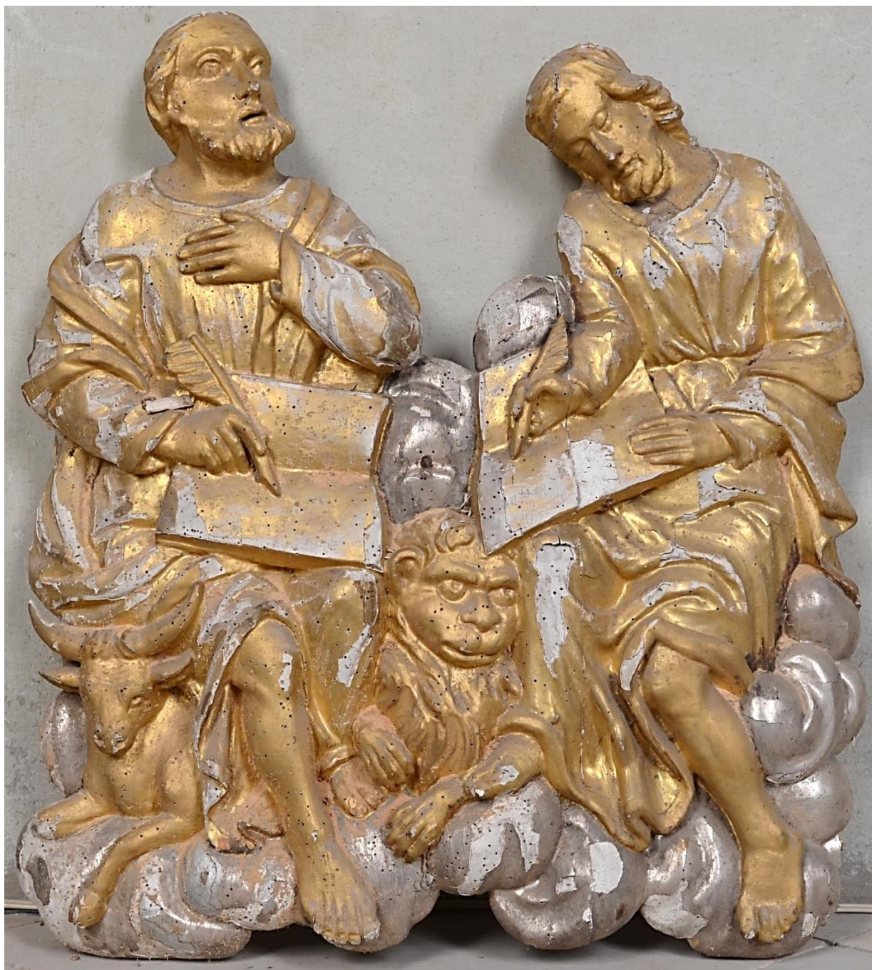
Evangelisté sv. Matouš a sv. Marek